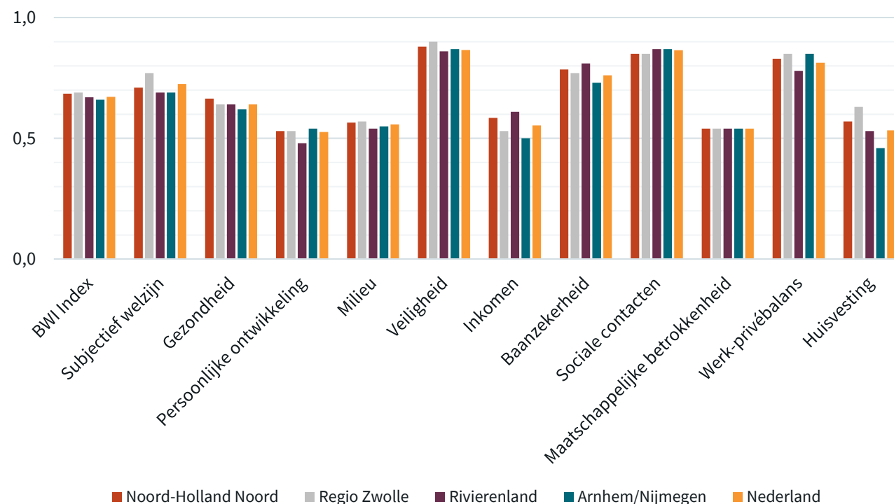
Brede Welvaartsindex (2019) Noord-Holland Noord